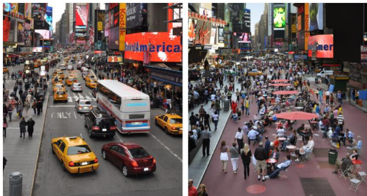
Times Square w Nowym Jorku, przed i po transformacji dokonanej w duchu taktycznego urbanizmu