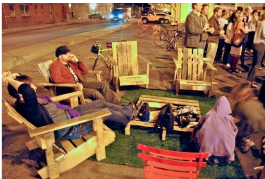
Przykład chairbombingu, czyli spontanicznego ustawiania krzeseł i ławek w miejskiej przestrzeni

W Polsce oddolne ruchy obywatelskie mają solidne fundamenty. Polskie społeczeństwo potrafi się jednoczyć w różnych sprawach, zaczynając od podziemnego ruchu oporu w czasie II wojny światowej, przez powstanie „Solidarności” w PRL-u aż do aktualnych przykładów jak Ogólnopolski Strajk Kobiet lub „Marsz Miliona Serc”. Nie były to działania odnoszące się do problemów przestrzeni miejskich, ale stanowiły przykład ogólnej niechęci i buntu w stosunku do panującej sytuacji polityczno-społecznej. Nad Wisłą już od początku XXI wieku rozkwita „samoorganizacja przestrzeni” pod postacią partyzantki ogrodniczej, formowania się grup w obronie likwidowanych miejsc oraz rozwoju inicjatyw sąsiedzkich 48 . Mieszkańcy miast zrobili już pierwszy krok i wzięli sprawy we własne ręce, ale teraz oczekują przede wszystkim otwartości ze strony władz lokalnych.