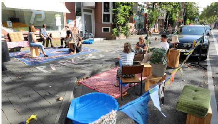
Akcja Park(ing) Day w Karlsruhe w 2020 roku

Taktyczny urbanizm to także działania mające na celu niskokosztową estetyzację przestrzeni miejskich. Aktywiści starają się upiększać zabetonowane ulice przede wszystkim przemaslowując asfalt, tworząc na jezdni różnokolorowe wzory oraz murale. Tak odnowione przejścia dla pieszych czy skrzyżowania nie tylko podnoszą wartość estetyczną, ale i sprawiają, że te newralgiczne miejsca stają się bardziej bezpieczne. Kolorowe projekty upiękzyły ulice choćby Nowego Jorku (mural na Times Square), Mediolanu (mural na PiazzaAperte), Bogoty (program przemaslowania skrzyżowań Plazoletas ) i Providence (program rysowania murali na skrzynkach transformatorowych).