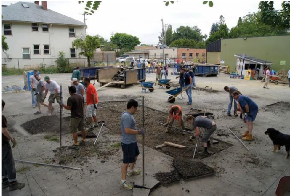
Zrywanie starej i niepotrzebnej nawierzchni w ramach taktycznego urbanizmu