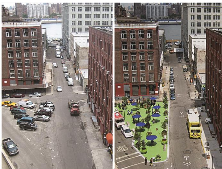
Taktyczny urbanizm w praktyce. Transformacja Pearl Street na Brooklynie