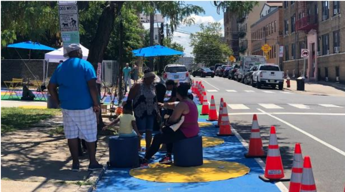
Zajęcie pasa ruchu przez mieszkańców w amerykańskim Jersey City w 2022 roku