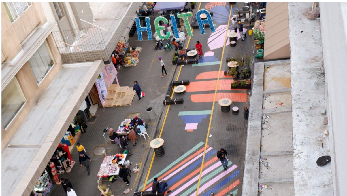
Przykład taktycznego urbanizmu w Johannesburgu w RPA