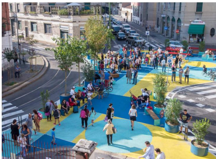
Plac Piazza Aperte w Mediolanie po akcji upiększenia