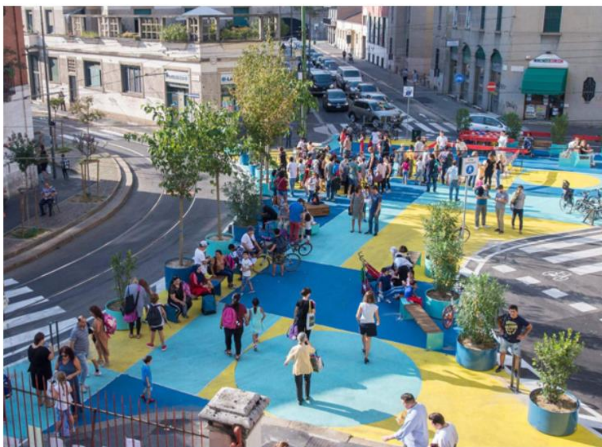
Plac Piazza Aperte w Mediolanie po akcji upiększenia