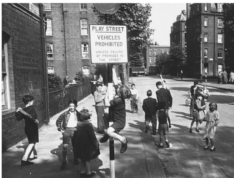
Wczesny przykład projektu play streets w Stanach Zjednoczonych